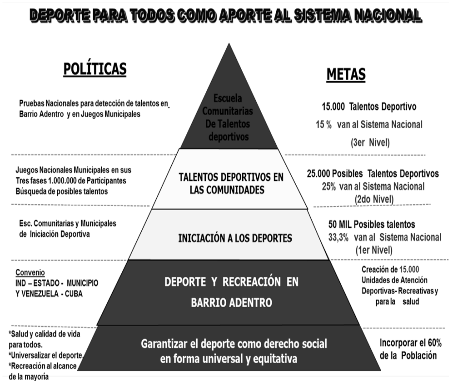
Figura 2. Ministerio del Poder Popular para el Deporte (MPPD, 2006)

Por otro lado, en el Plan Nacional de Deporte, Actividad Física y Educación Física 2013-2025 (2012), se enfoca, la directriz central de Venezuela como Potencia Deportiva del Siglo XXI basándose para ello en la masificación de la Educación Física, la Actividad Física y el Deporte en beneficio de toda la población y la Tecnificación del Deporte de Alto Rendimiento. Con (Ley Orgánica de Deporte, Actividad Física y Educación Física, 2011) se inicia un proceso de transformación en la promoción, organización y administración del deporte y la actividad física como servicios públicos, reconociéndolos como derecho fundamental de los ciudadanos y ciudadanas y como un deber social de Estado.